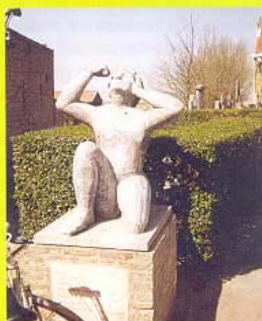
Fleris in Wilskerke