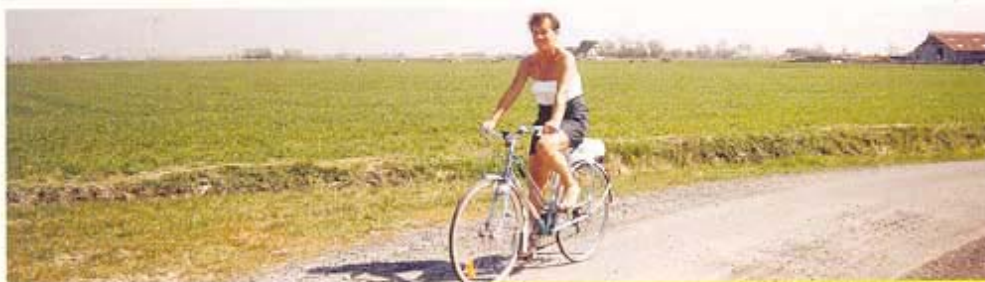
Genieten van de natuur

Intussen wenkt het kanaal Nieuwpoort-Plassendale. In plaats van direct de dijk langs het water te volgen, maken we een ommetje naar Westende. In de buurt van de Sint-Niklaaskerk kan je naar believen de innerlijke mens versterken. Wie wil, kan even de Noordzee gaan bekijken. Vandaar dat deze plek voor de vakantiegangers een ideaal startpunt is voor onze route.