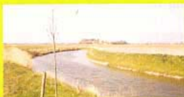
In het Krekengebied

Vlaamse kustgemeenten die naast hun attractiepolen in de onmiddellijke omgeving van het strand het fietstoe-risme in de achterliggende polderdor-pen promoten, verdienen een pluim