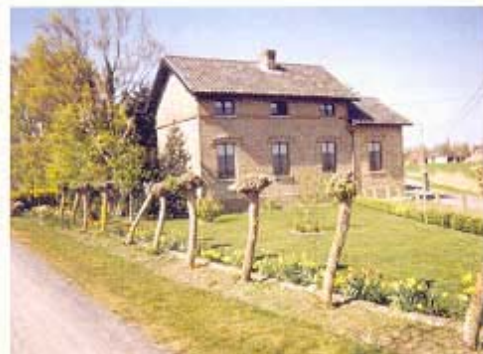
*' Routekotje om uit te blazen

FMK-waardering: een route om "u" tegen te zeggen, niet te missen dus.