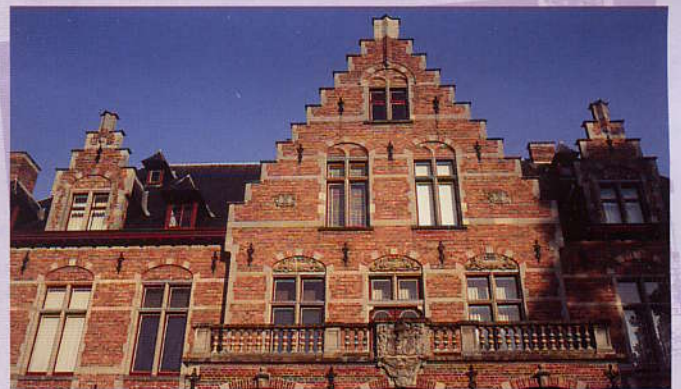
gevel kasteel de Herten