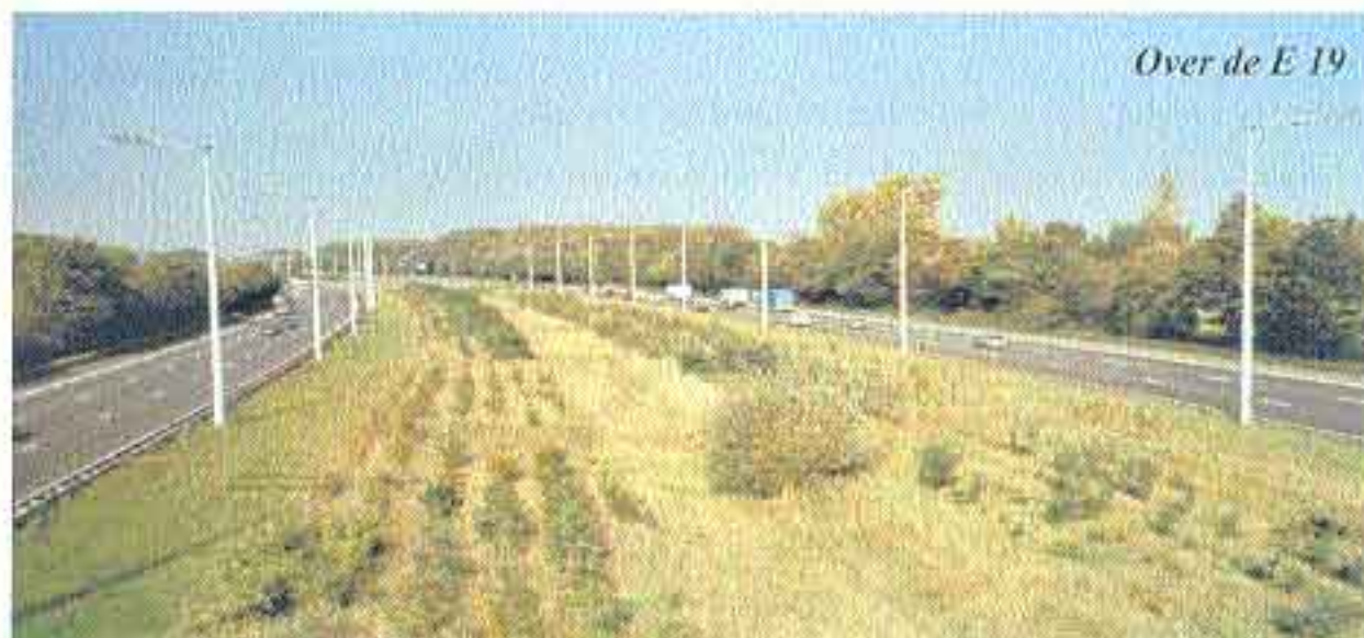
Over de E 19

Op naar het imposante dorpsplein van Kampenhout. Daar kijkt de "Witloofboer" ons vragend aan: "Ja, het is goed geweest, we hebben er van genoten. Vertel dit gerust verder!".