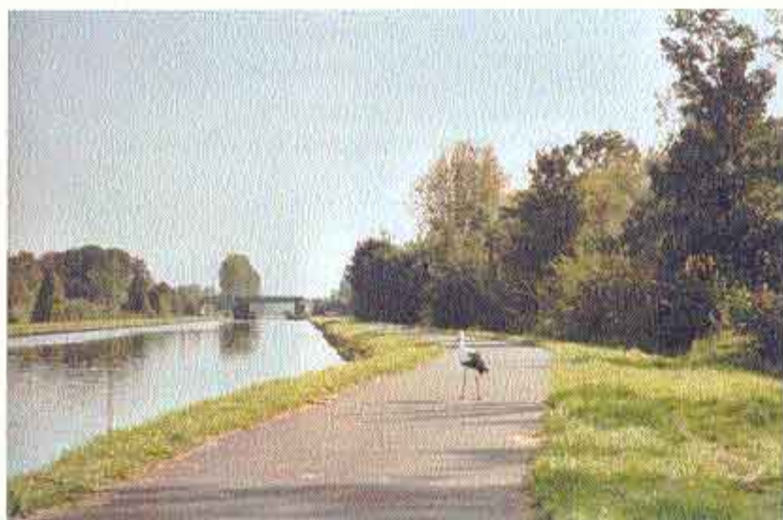
Hella, dat is mijn terrein

De echte gebruiker nu is de ooievaar. Hovaardig verspert hij ons de weg en kijkt ons verstoord aan. Alhoewel hij natuurlijk niet kan spreken, weet hij ons precies te vertellen dat dit hier zijn terrein is. We hebben het begrepen. Dus stappen we bedeesd van de fiets en gaan hem