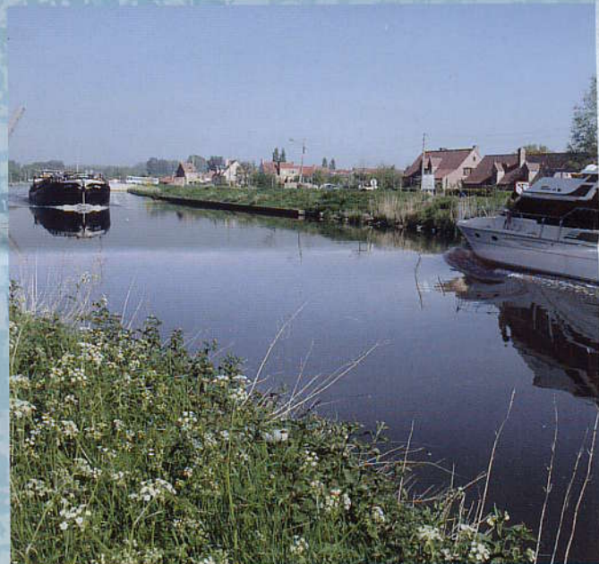
scheepvaart op het kanaal Gent-Brugge