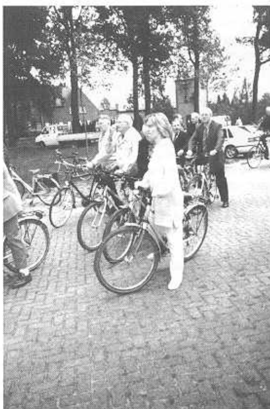
Wachten op het 'startschot' in de Kolonie van Wortel